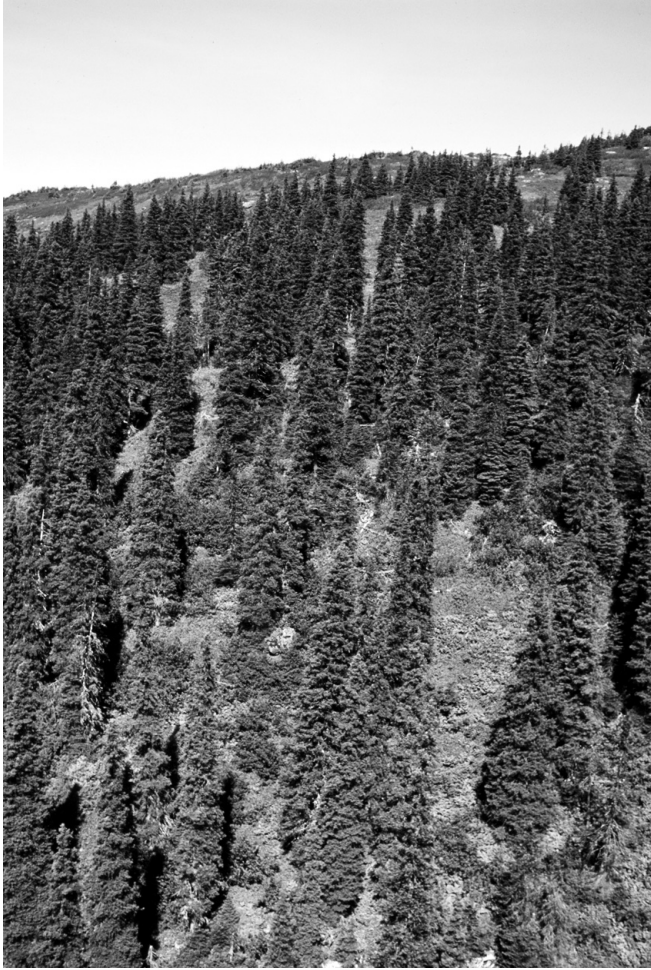
MICHAËL VILLENDE - MNR