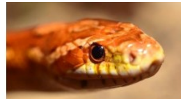
le serpent des blés et ses deux paires d'yeux

La plupart des serpents possèdent deux paires d'yeux, l'une d'elles est située sous leurs narines et permet d'étendre leur domaine visible. On estime que le serpent des blés (photo ci-contre) peut percevoir des ondes électromagnétiques de fréquences comprises entre 6,00 \times 10^{13} Hz et 7,50 \times 10^{14} Hz