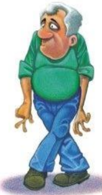
Besoin d'uriner fréquemment