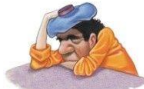
Mal de tête