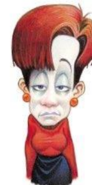
Fatigue extrême et pâleur