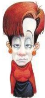
Fatigue extrême et pâleur