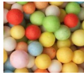
bille de polystyrène