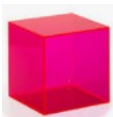
cube en plastique