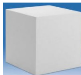
cube en polystyrène