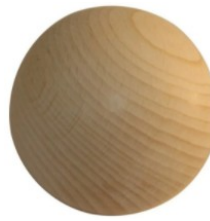
bille en bois