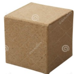
cube en carton