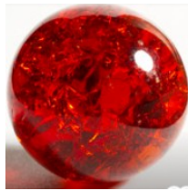
bille en verre