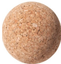
bille en liège