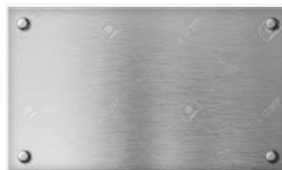
plaque de métal