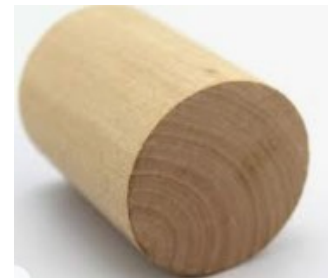
cylindre en bois