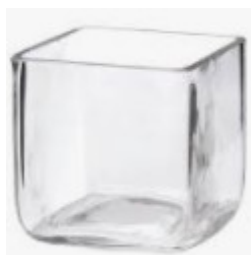
cube en verre