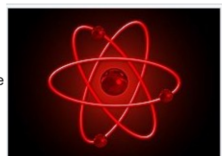
Représentation artistique d'après la perception populaire du modèle de Bohr , montrant des électrons orbitant autour d'un noyau atomique.

Les premières approches ( Modèle de Bohr ) consistaient à croire que les électrons circulaient autour des atomes sur des orbites , de manière identique aux planètes autour du soleil, mais on remarqua rapidement que cela conduisait à des inconsistances en matière magnétique : les électrons seraient très vite tombés sur le noyau.